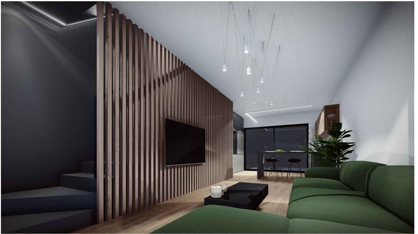
Interijer Dnevni boravak