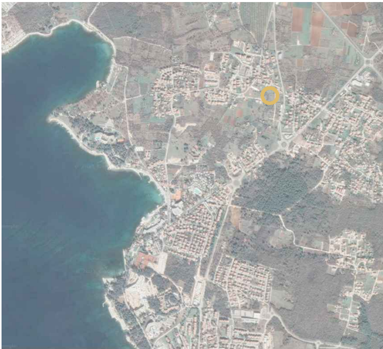
Šira i uža situacija